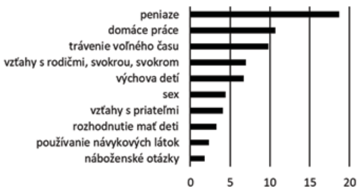
Graf č. 4: Nezhody s manželom/kou, partnerom/kou (%)

Odpovede na témy konfrontácií v domácnosti dokresluje aj otázka očakávaní respondentov od inštitucionalizovaného náboženstva. Pri výpovediach sedem z desiatich respondentov má názor, že cirkvi sú tu na to, aby vychovávali ľudí k vzájomnej úcte a pomoci, aby podporovali dobré vzťahy v rodinách, aby dávali ľuďom duchovnú útechu, aby napomáhali k stabilite rodín, aby sa zasadzovali za morálku, aby vychovávali k viere. Piaty z desiatich očakávajú od cirkvi, aby pri rodinných krízach viedli ľudí k zmieru. Štyria z desiatich opýtaných ale tiež očakávajú, že cirkvi by mali pri neriešiteľnom alkoholizme alebo násilí iniciovať odluku alebo rozvod.