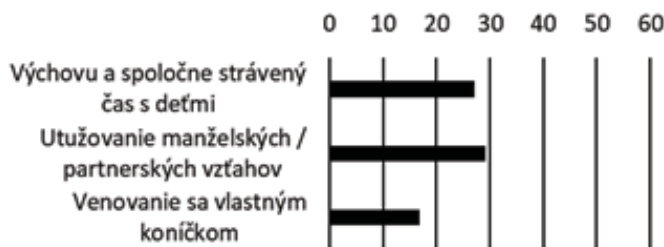
Graf č 2: Muži - dostatok času na (%)

Ďalšou oblasťou je hodnotenie časových možností vnútrorodinných aktivít.